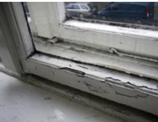
Abb. 1: Auch dieses über Jahrzehnte vernachlässigte Kastendoppelfenster lässt sich auf moderne Standards aufrüsten.

sanierung zusammengetragen und veröffentlicht. Auf einzelne dieser Bearbeitungsregeln soll hier kurz eingegangen werden.