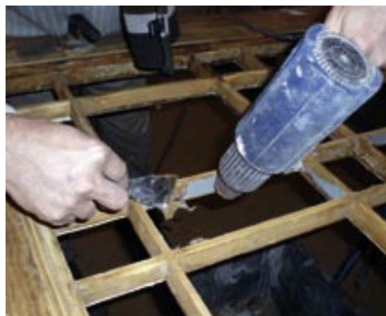
Abb. 3: Vollständiges Abbrennen von brüchigen Beschichtungen

Es ist nicht grundsätzlich notwendig, den gesamten Altanstrich zu entfernen. Wenn der Bestandslack über eine gute Standfestigkeit verfügt und keine Risse aufweist, hat er sich bestens bewährt und bietet einen hervorragenden Untergrund für weitere Beschichtungen. Sämtliche – nicht einwandfreien – Lackoberflächen müssen allerdings durch Abschleifen oder Abbrennen sorgfältig entfernt werden (Abbildung 3). Die freigelegten Holzoberflächen werden mit einer RAL-geprüften