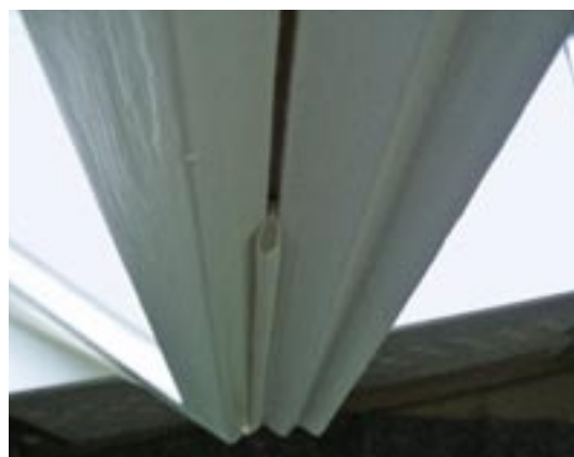
Abb. 4: Schlauchdichtung in eingefräster Nut

Die Aufrüstung eines Altbaufensters für den Wärmeschutz ist in vielen Fällen auch ein formales Problem; denn die schlanken Ansichten der Profile sollten so weit wie möglich erhalten bleiben. Den Schwachpunkt der Wärmedämmung bilden die meist nur 4 mm starken Scheiben der inneren und äußeren Flügel. In die innere Flügelebene, die auch gegen Zugluft abgedichtet wird, kann